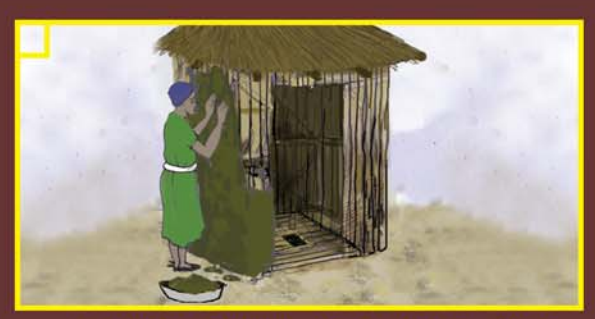
ዙሪያውን ግድግዳ ሰርቶ ሰጣሪው ክዳን አበጀቶ ወለሱንና ግድግዳውን በጭ ቃ ወይም በእበት ማ ምረግ።